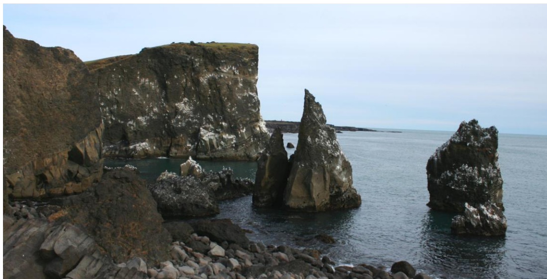
Við Valahnúk neðan Reykjanesvita.

Á næstu mynd eru einkunnirnar sem þátttakendur gáfu flokkaðar sem hér greinir: