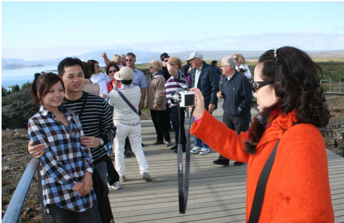
Ferðamenn á Þingvöllum

Reykjanesvita, Þjóðgarðinum Snæfellsjökli, Landmannalaugum, Skógafossi, Geysir, Þingvöllum