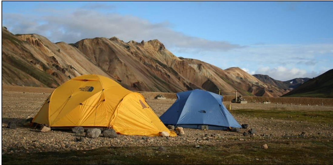
Tjaldgestir í Landmannalaugum.

Ekki munaði miklu á upplifunareinkunn staðanna, en Landmannalaugar og Snæfellsjökull skoruðu þó hæst, þá Skógafoss, en Þingvellir og Geysir fylgdu þétt í kjölfarið. Reykjanesviti rak lestina.