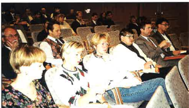
Ferðamálafulltrúar á fundi fyrir Vest-Norden 1994.