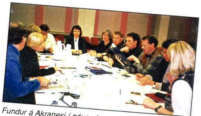
Fundur á Akranesi í nóvember 1995.