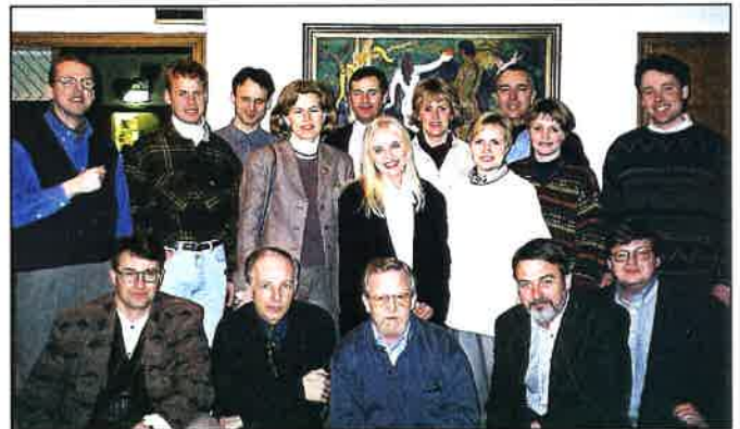
Fundur á Flúðum í mars 1995.