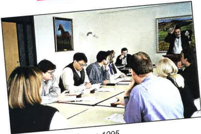
Fundur á Flúðum í mars 1995.