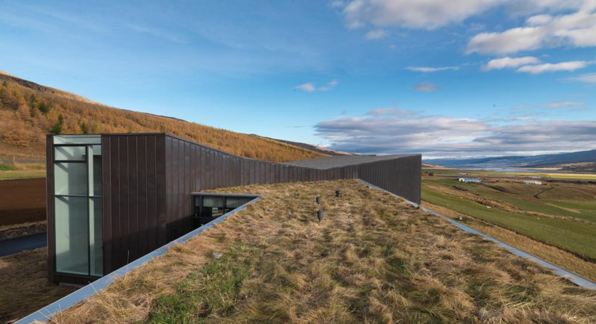
Menningarstefna í mannvirkjagerð í verki Snæfellsstofa, gestastofa Vatnajökulsþjóðgarðs