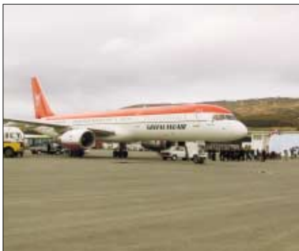
Vél Grænlandsflugs á Akureyrarflugvelli.

Akureyri er þó ekki eini flugvöllurinn utan Keflavíkur sem nýtur beinna samgangna við útlönd því líkt og í fyrra mun LTU halda uppi flugi á milli Düsseldorf og Egilsstaða í