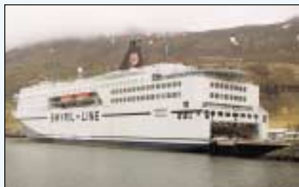
Ný Norræna við bryggju á Seyðisfirði.

Áætluð ferðir nýrrar Norrænu hingað til lands hófust 15. maí sl. Skipið hefur reynst vel í alla staði en um algera byltingu er að ræða því hin nýja Norræna er meira en tvöfalt stærri en sú gamla. Skipið er 165 metrar á lengd, ber 1.500 farþega og allt að 800 bíla.