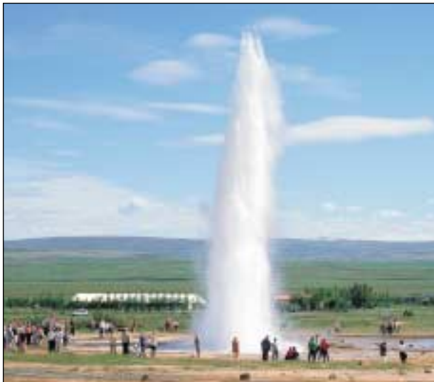
Fjármunir hins opinbera til markaðssóknar íslenskrar ferðaþjónustu hafa ekki áður verið meiri á einu ári.

Eins og sagt var hér að framan var fjármunum skipt á fjögur markaðssvæði. Í grundvallaratriðum var skiptingin þannig að á